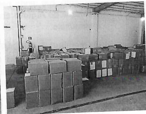
Figuras 4,5 e 6: vista geral