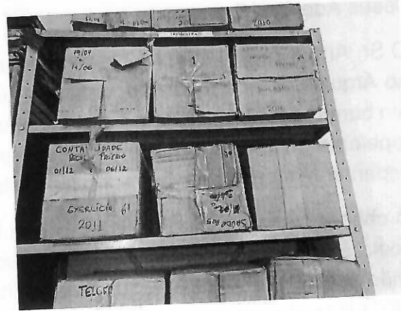
Figura 2: prateleira com caixas da Contabilidade sem etiqueta